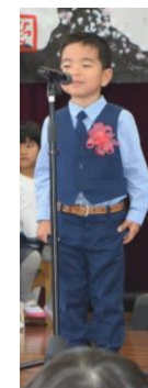
とうましようたろう