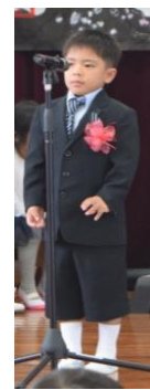
たいらいゆうせい