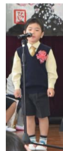
てるきなしゆんと