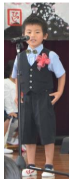
あずましんのすけ