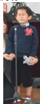
しんざとはりゆう