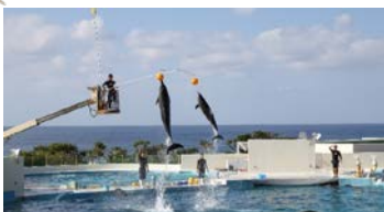
すごいジャンプ力に拍手！