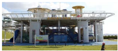
懐かしのアクアポリスの形・アクアタウンでいっぱい遊んだよ！！