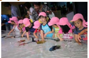
ひとで・ナマコと触れ合い