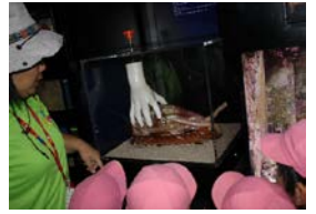
危険生物・電気仕掛けで解説、不思議そうに見えます