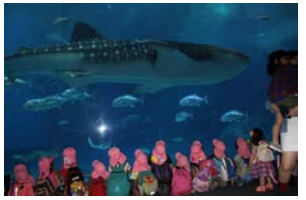
ジンベイザメ大きいな～！