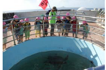
竜宮城はどこかな～？