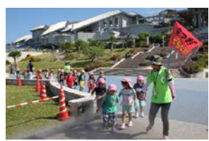
エアミストストーリーで、しばし涼む！！