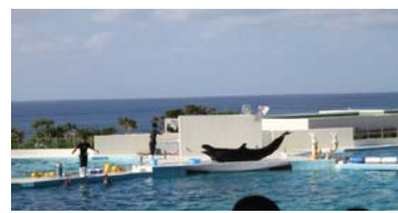
たくさん餌が欲しいごんちゃん